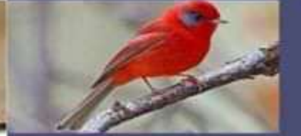
Chipe Rojo Cardellina rubra