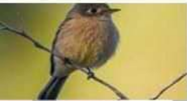
Papamoscas Pecho Canela Empidonax fulvifrons