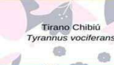
Tirano Chibiú Tyrannus vociferans