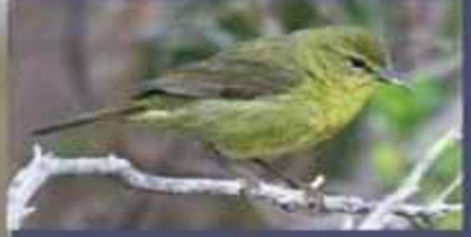
Chipe Oliváceo Oreothlypis celata