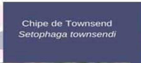
Chipe de Townsend Setophaga townsendi