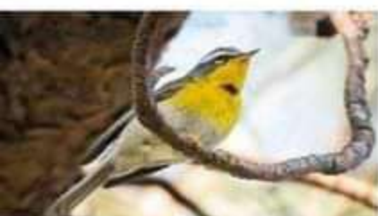
Chipe Cejas Blancas Oreothlypis superciliosa